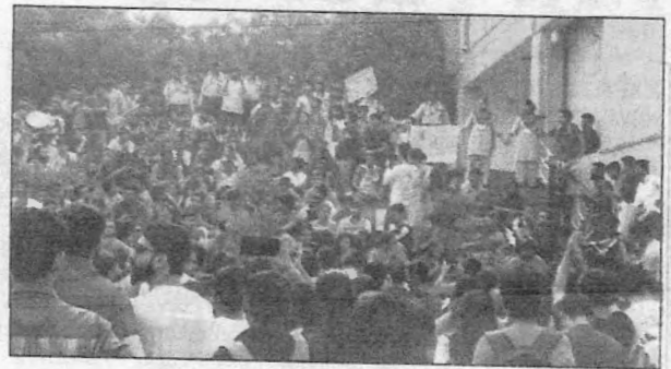
Students protested at the administrative block Thursday